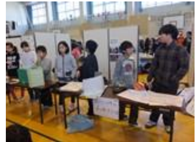
（エネルギー・環境ワークショップ）