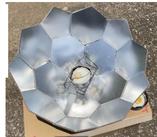
サッカー ボール クッカー