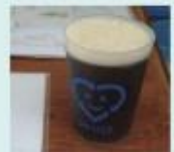
イベントでのリユース食器

雨の日に大量に出る使い捨て傘袋を減らす「マイ傘袋作り講座」、イベントでは飲食ブースでリユース食器を活用、ペットボトルを減らすためにマイボトル推進などを行っています。他に、地元野菜を使った「エコなクッキング講座」なども。