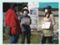
イベントでのエコクイズ

「登戸まちなか遊緑地」や「民家園通り夏祭り」などの多摩区内イベントに参加。イベントを訪れた人たちに、エコな課題やSDGsについて知っていただくクイズなどを実施、地域とのつながりを深めることも目指しています。