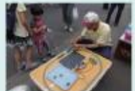
ソーラー発電を利用した電車のおもちゃ体験

地域の人に再生可能エネルギーを身近に感じてもらうための体験イベントを開催しています。ソーラー発電で動く電車のおもちゃや木質ペレットでの調理など、実際に手で触れて再生可能エネルギーを体験することができます。