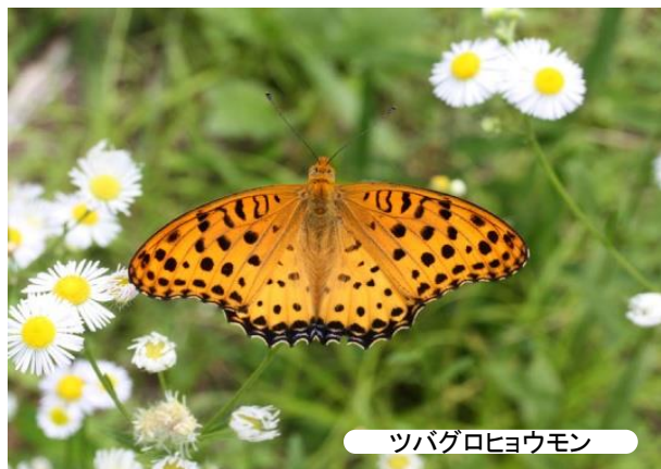
ツバクロヒョウモン