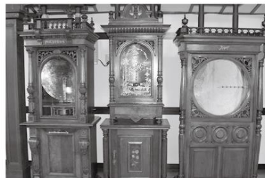
アンティークオルゴール