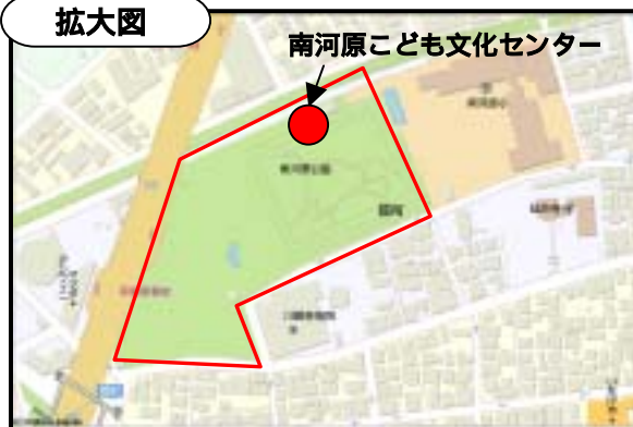
南河原こども文化センター