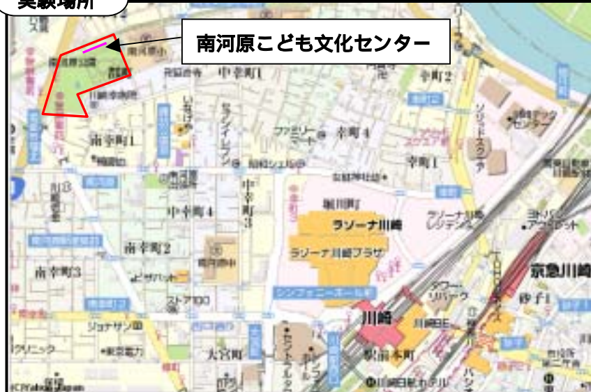
南河原こども文化センター