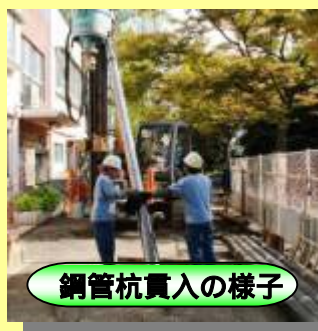
鋼管杭貫入の様子