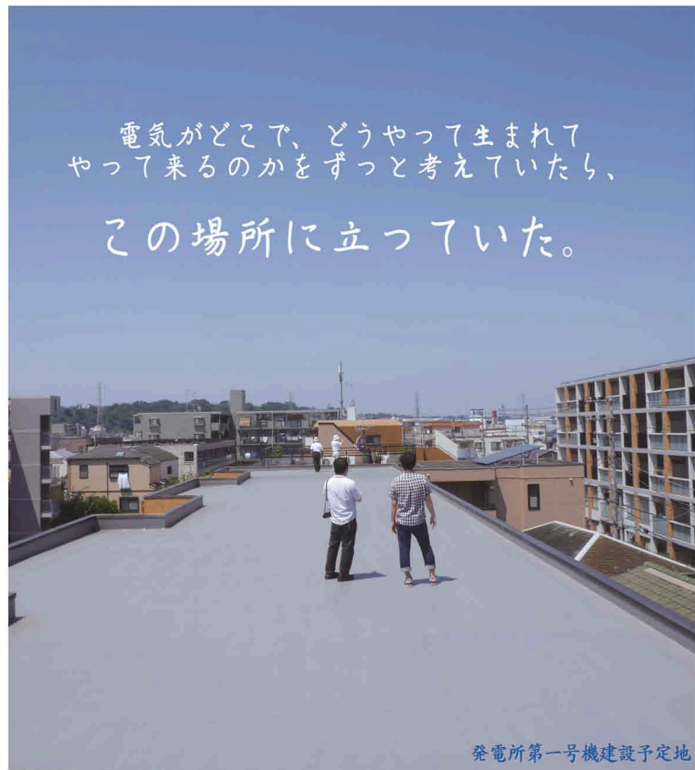
発電所第一号機建設予定地

電気がどこで、どうやって生まれて やって来るのかをずっと考えていたら、 この場所に立っていた。