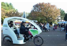
自転車タクシー試乗会