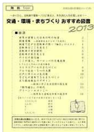
情報提供事業 (おすすめ図書)