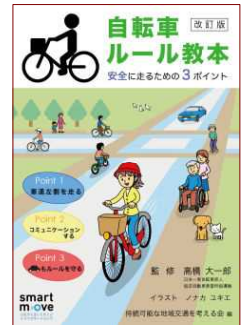
『自転車ルール教本』 制作と指導者育成