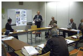
コミュニティバス連絡会