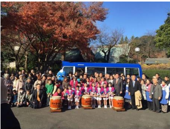
市長も参加した出発式(平成26年12月13日)

平成 20 年 9 月 協議会(C協)発足 平成 23 年 11 月～12 月 運行実験実(1カ月) 平成 25 年 7 月～9 月 試行運行実(3カ月) 平成 26 年 12 月 本格運行開始