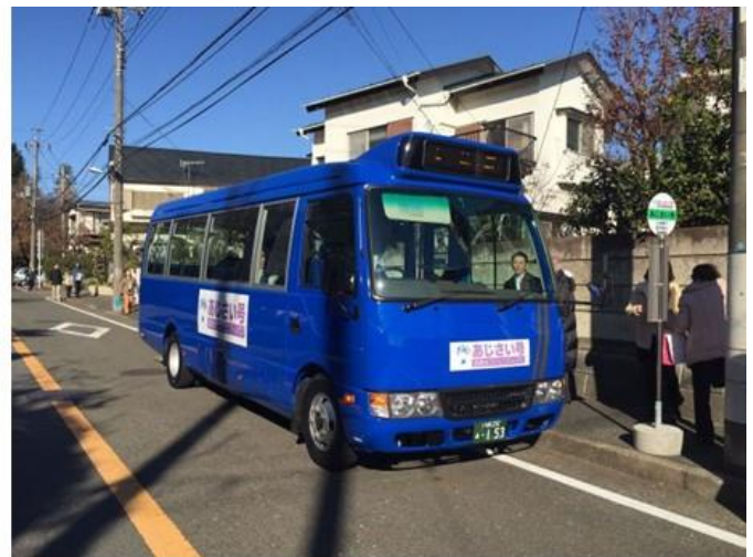
長尾台を走る「あじさい号」